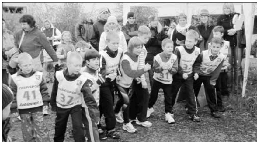
Naši borci na startu