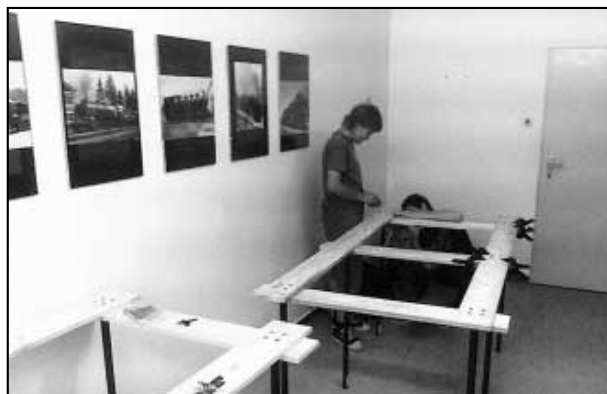
V plném modelářském tempu.

Stavba trati zahájena! - Činnost modelářského kroužku byla tento rok zahájena plnou parou! Brzy budou hotovy všechny dřevěné rámy, na které budeme již moci projektovat realitu v modelovém měřítku. Celé kolejiště bude