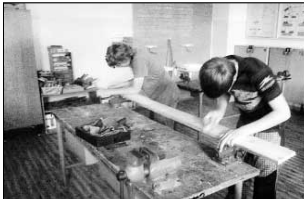
Příprava dřevěných trámů.