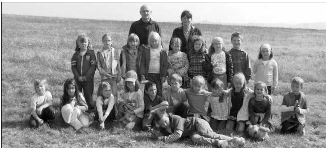
Velká parta prvňáků

Když jsme šli na vlak, tak jsme se trochu proběhli, protože jsme nestíhali. Cesta byla dobrá a všichni jsme se těšili domů. BYLA TO MOC PĚKNÁ ŠKOLA V PŘÍRODĚ.