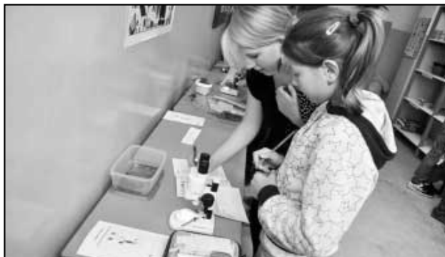
Zkoumání v nové učebně