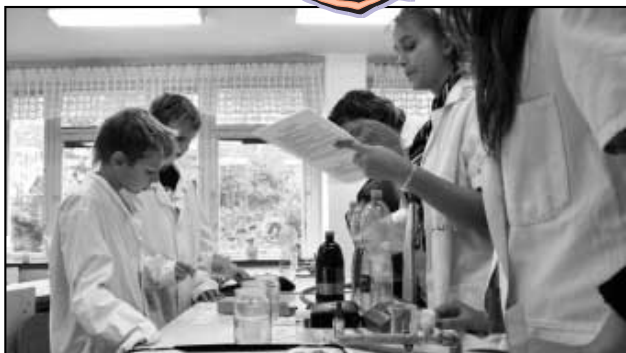
V učebně chemie