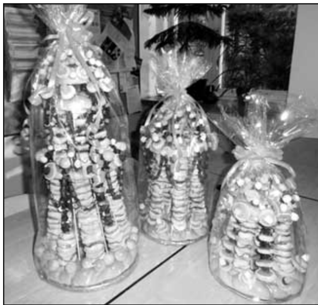
Originální ceny pro ty nejlepší.

Sdružení Rodiče Povrly, učitelům a žákyním z vyšších ročníků. Ti všichni se podíleli na organizaci soutěží a na pečení a zdobení perníčků, kterými byli obdarováni dětská účastníci řádění.