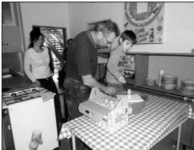
Stavění komínu na vodní hladině.

Velké poděkování patří všem maminkám a tatínkům ze