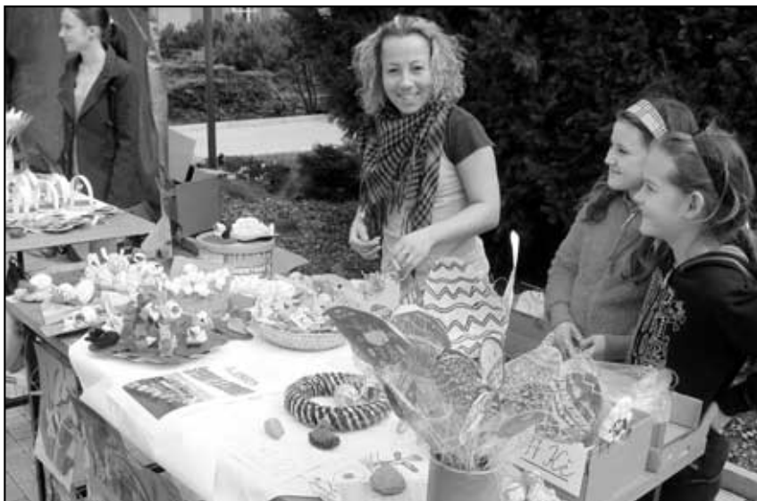
Stánek 1. a 2. třídy.

Jarmark napřesrok určitě zopakujeme, a když nám k tomu bude svítit sluníčko jako letos, budeme nad míru spokojeni.