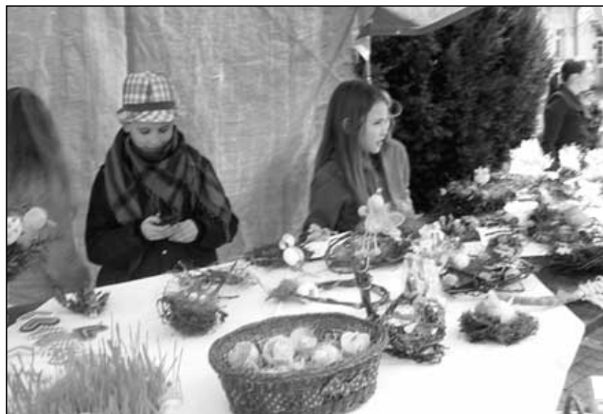
Stánek 4. třídy.