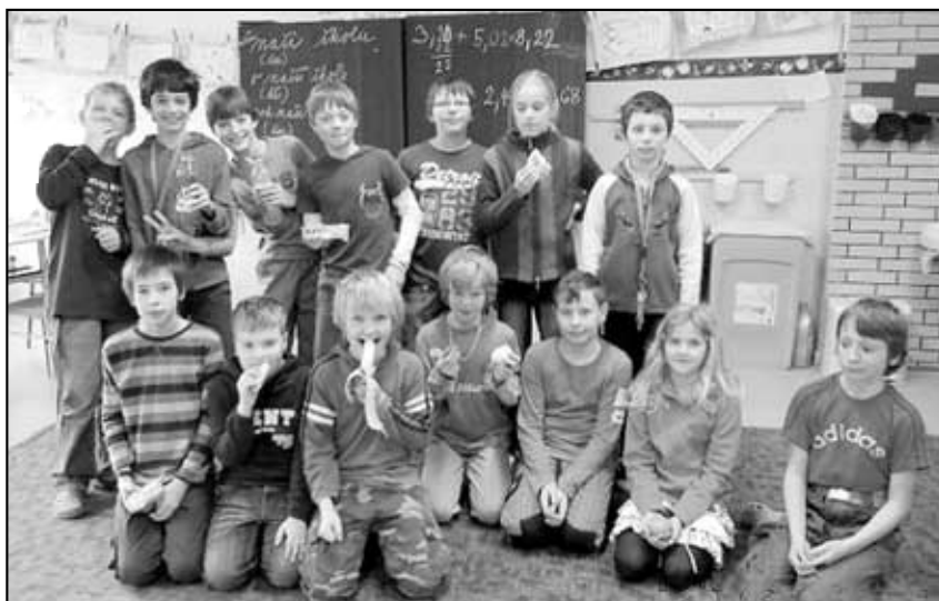
Výherci projektu „Výživa hrou.“

Kdo se mezi stánky našeho jarmarku třeba jen prošel, viděl, že toho, co žáci nabízeli, bylo opravdu hodně. Krásné dekorativní výrobky, šperky, ozdoby a dokonce i velikonoční nádivka a perník lákaly kolemjdoucí k utrácení. A to jsme potřebovali. Každá třída vydělané peníze použije na nákup něčeho užitečného. Někdo na třídní tematický výjezd, někdo třeba na výtvarné pomůcky.