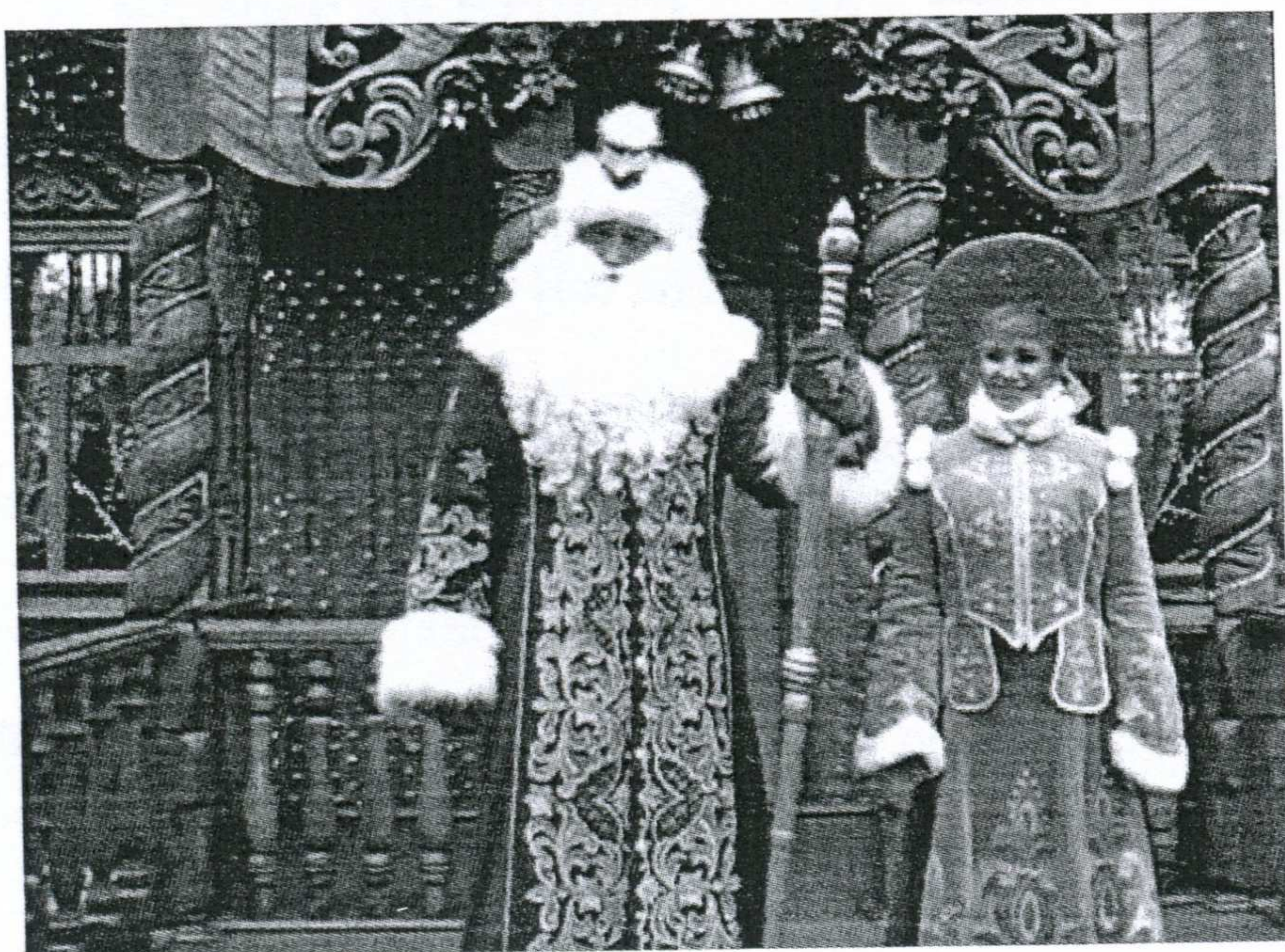
Děda mráz a Sněhurka